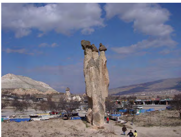
De feeënschoorsteen kan men niet onverlet voorbij.

Er wordt ook een bezoek voorzien naar de Zimi vallei.